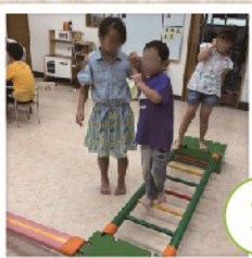
技巧台で体のバランスを保ちます。