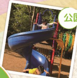
子どもたちの関わりが深まります。