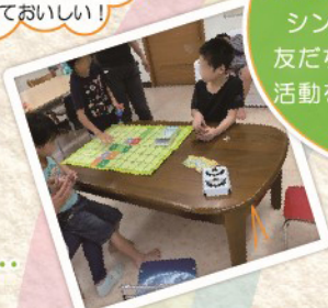
テーブルゲームでルールを学びます。