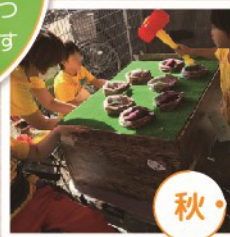
地域の方たちと交流